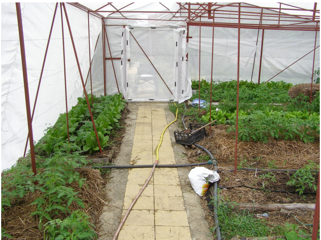
Та же схема в моём сетчатом домике. Юг слева.

5. ЗАПЛЕТАЙТЕ СТЕНЫ, БЕСЕДКИ И ЗАБОРЫ. Если, конечно, вам не лень осенью их очищать и распутывать. 😊