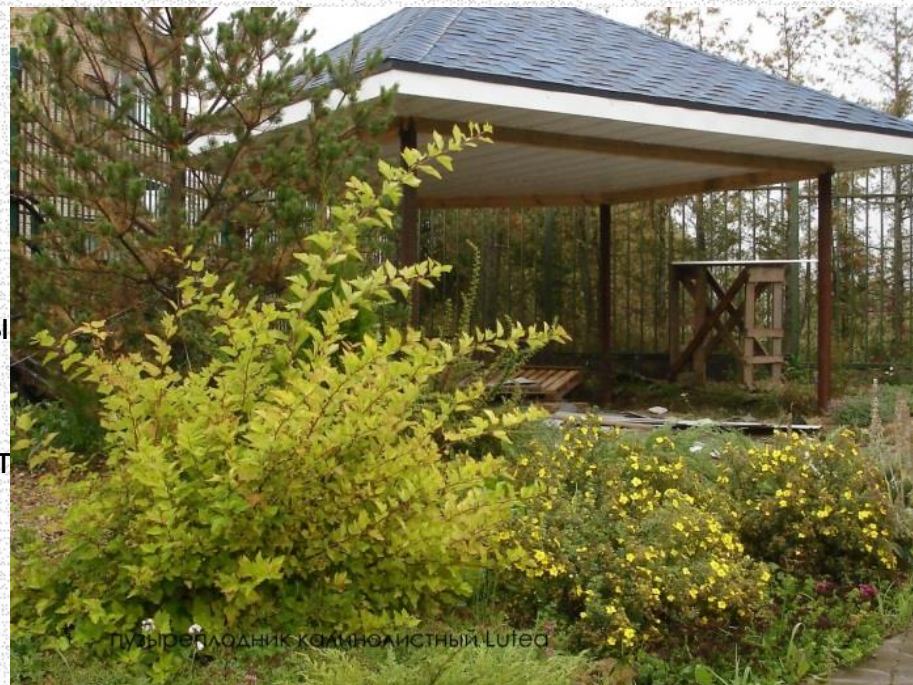
Пузыреплодник калинолистный Lutea