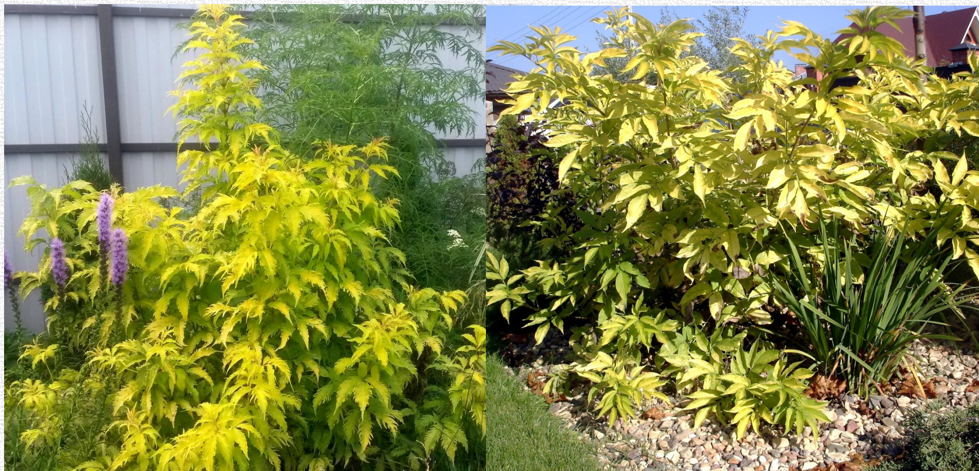
Бузина кистистая Ауреа