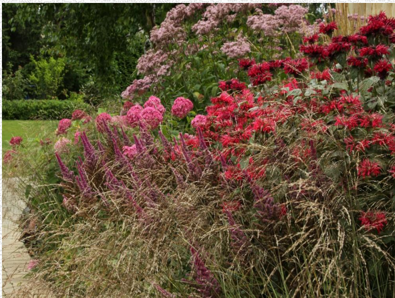
композиция Малиновый Этюд